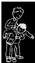
Thematekening week 4 • zie www.kindopmaandag.nl

In de Bergrede draait Jezus dingen om. Juist de kleinen zijn groot. Jezus vraagt om meer dan het gewone te doen en vertelt de mensen dat God voor hen zorgt. Wanneer doen leerlingen meer dan er van hen gevraagd wordt?